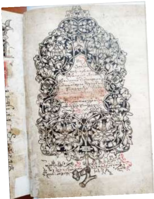
Азбуковник. 1613 г.